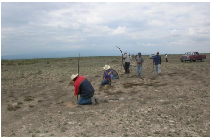
Cercando una de las áreas en el ejido El Salado

Las acciones llevadas a cabo en el ejido El Salado buscan conservar los pastizales del área que son ecosistemas únicos ya que en ellos viven especies de plantas y animales que no se encuentran en otras partes de México, ni del mundo. Estas acciones han consistido en cercar áreas para evitar que entre el ganado y favorecer que se recuperen los pastos y las especies que viven en ellos. Se evaluarán cinco de las áreas que han sido cercadas en el ejido, en diferentes fechas: Las Calabazas (2004), Palos Altos (2006), San Benito (2004), Milpa Vieja (2006) y Camino a San Juan de la Cruz (2005).