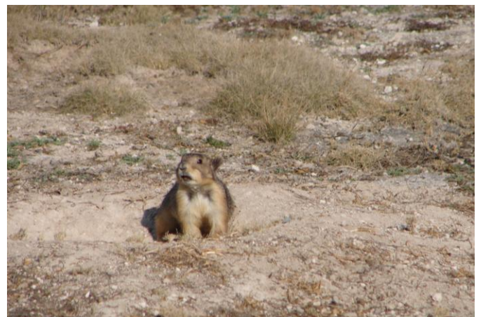
El perrito llanero mexicano, especie única de estos pastizales